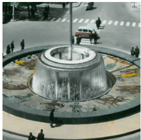
Fontana, P.zza Tacito

L'opera dell'architetto romano Mario Ridolfi è stata fondamentale per la ricostruzione della città di Terni nel dopoguerra. Il legame tra Ridolfi e la città di Terni, già iniziato negli anni Trenta, con la realizzazione della fontana di piazza Tacito e la partecipazione al concorso nazionale per il nuovo piano regolatore, continua nell'immediato dopoguerra con il piano di ricostruzione e, nel 1960, con il piano regolatore, per proseguire fino agli anni Ottanta con la redazione di alcuni piani particolareggiati del centro città. La sua opera è orientata a creare un'immagine nuova della città, rimodellando il centro antico, ridisegnando gli spazi funzionali, rivalutando le periferie; tutto ciò dando grande rilievo all'uso dei materiali, primo tra tutti la pietra sponga, ma anche i mattoni, il cemento armato e le maioliche, rendendoli funzionali all'arredamento dei palazzi. Alcuni degli edifici progettati da Ridolfi sono capolavori di architettura, come le case Chitarrini, Franconi e Pallotta, i palazzi Briganti e Staderini, la scuola media Leonardo da Vinci, il complesso Fontana e la casa Lina a Marmore.