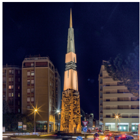
Lancia di Luce (obelisco)

La città di Terni, soprannominata anche "Città dell'Acciaio" o "Manchester italiana" per la sua connotazione industriale sviluppatasi a partire dal XIX secolo, è conosciuta soprattutto per le Acciaierie, uno dei colossi della siderurgia italiana. L'acciaio e il rumore della fabbrica rivestono un ruolo molto importante nella storia di questa città, profondamente segnata dal grande boom industriale scoppiato nel secondo dopoguerra. Ad evidenziare anche simbolicamente questa vocazione industriale: l'obelisco di Arnaldo Pomodoro alla fine di corso del Popolo, l'Hyperion di Agapito Miniucchi nel piazzale dell'Acciaio e la Grande Pressa, un monumento di 12.000 tonnellate collocato nel piazzale antistante la stazione ferroviaria. Da ricordare i siti di archeologia industriale oggi trasformati in musei o poli cinematografici e multimediali, quali il Museo delle Armi che si trova proprio nella ex Fabbrica d'Armi, o il "CAOS - Centro Arti Opificio Siri", un centro culturale dedicato alla fruizione delle arti, nonché sede del Museo Archeologico e del Museo di Arte Contemporanea, nato dalla riconversione dell'ex fabbrica chimica SIRI.