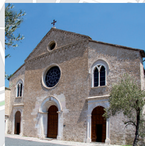
Chiesa di S. Francesco